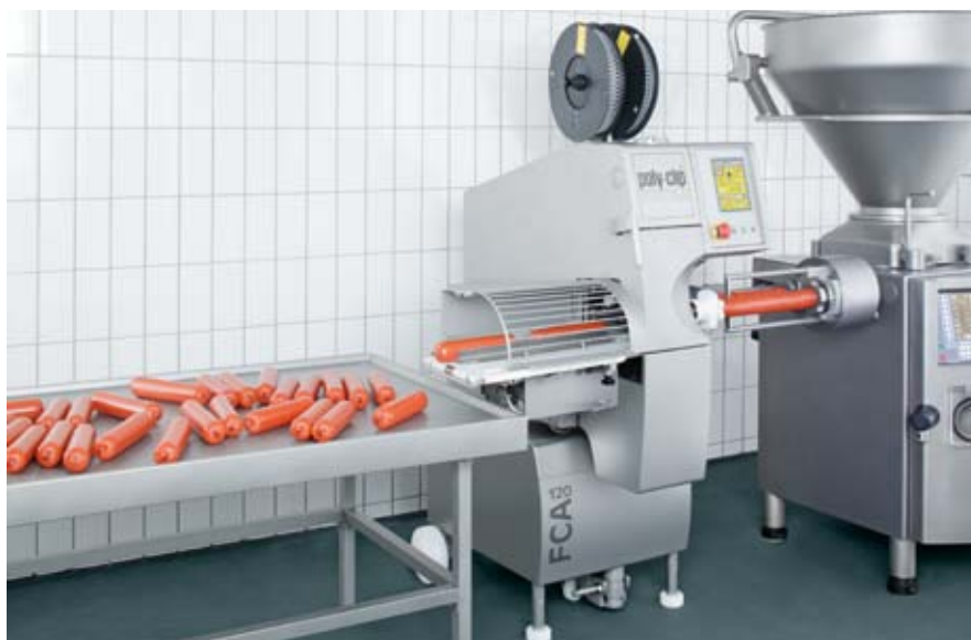
FCA 120 – la spécialiste pour la très grande vitesse dans la plage de calibre jusqu'à 120 mm