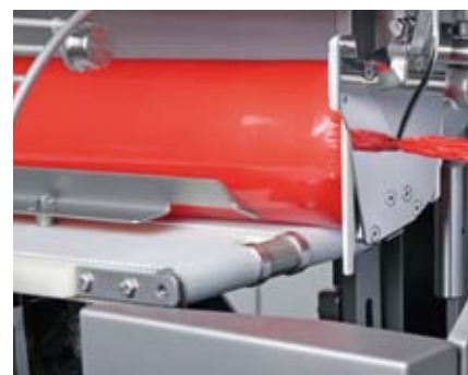
Surécartement pour un remplissage sans air de produits moulés