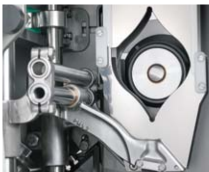
Portionneur linéaire vertical - de courtes oreilles