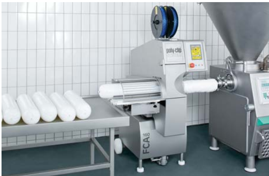
Puissante pour de grands calibres - FCA 160